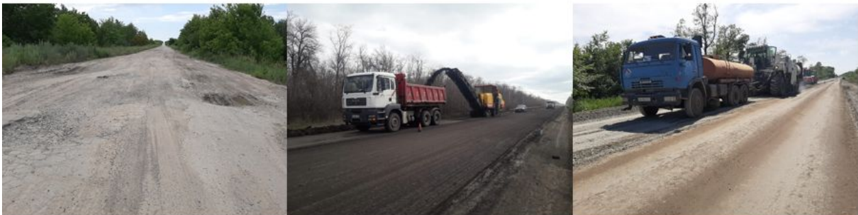
Автодорога Н-08, в Більмацькому районі поблизу с. Гусарки в напрямку смт. Більмак

Роботи з поточного середнього ремонту в Більмацькому районі, було розпочато 3 квітня 2019р., підрядною організацією ТОВ «Шляхове будівництво «Альтком»,